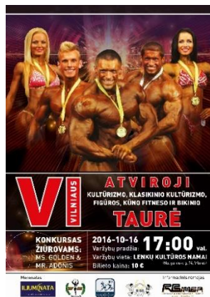
VT afiša, 2016-10-16